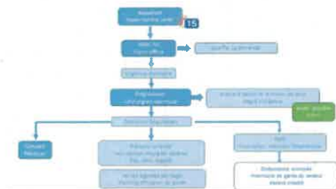
ANNEXE 1 – DÉROULE APPEL AU 15 / ACCÈS AUX SOINS D'URGENCE

En fin de régulation, à 16h, le CDR clôt les plannings des cabinets de garde via un onglet sur l'agenda partagé. Le CDG est informé en temps réel de l'horaire auquel sa garde se termine.